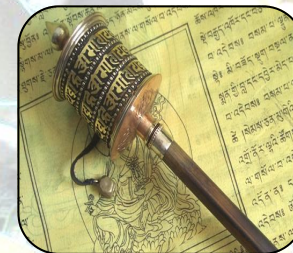
Tibetan religious ritual items